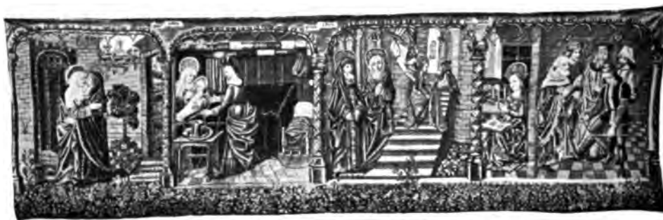
Tapissérie de l'église Notre Dame - la Vie de la Vierge 1 .

La Bourgogne avait eu de bonne heure ses salles de malades. La ville